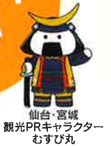
仙台・宮城 観光PRキャラクター むすび丸